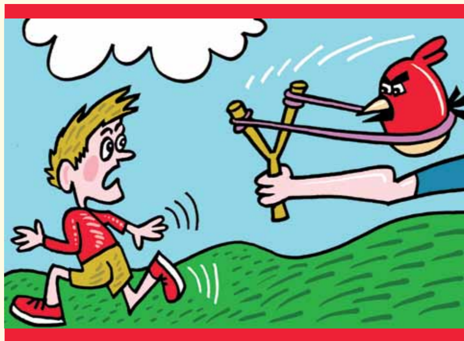
Ilustrace: Jiří Vančura

Posměch bolí, a proto se při něm můžeme přiklonit ke špatnému jednání. Posměch bolí, ale nesmíme se nechat zastrašit, podobně jako neustoupíme soupeři po jeho faulu. Při posměchu se pomodleme, abychom obstáli a zůstali věrní Pánu Bohu i jeho přikázáním.