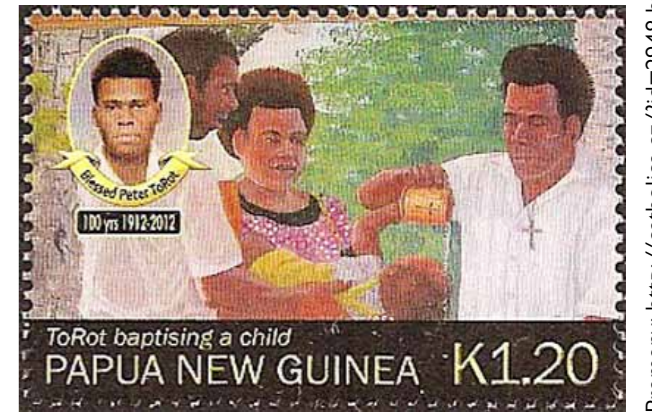
Prameny: http://catholica.cz/?id=2948 , http://www.claival.com/lettres/de/2008/12/17/171208.htm