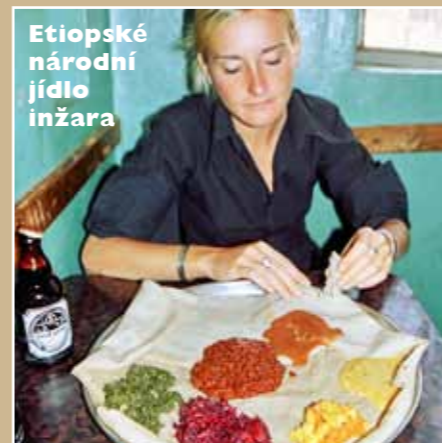
Etiopské národní jídlo injara

Když si vzpomenu na dva roky cestování po Africe, vybaví se mi hlad a žízeň. Většina území subsaharské Afriky je pro gurmána stezkou odvahy. Někdy není co jíst, jindy to nemá žádnou chuť a odporně to páchne nebo je to polosyrové maso neznámého původu, ze kterého lze snadno chytit nebezpečnou chorobu.