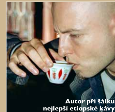
Autor při šálku nejlepší etiopské kávy

na ulici nepodává. Po několika dnech si začne na tajemně zvláštní chuť (zprvu nápadně připomínající zvratky) zvykat a nakonec se do ní zamiluje. V Etiopii se také vyrábí několik značek místních piv, kterým nelze nic vytknout, možná i díky tomu, že několik pivovarů tam stavěli Češi.