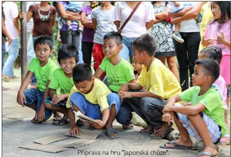
Příprava na hru "Japonská chůze".

Nízkoprahový dům Kuya center for street children slouží jako záchytná stanice pro kluky, kteří žijí na ulici a nemají kam jít, neboť jejich domácí situace je tak náročná, že potřebují odejít, aby získali sílu a odvahu k novému životu. Kluci jsou buď sirotci, jejichž situace je donutila k užívání drog, aby zapomněli na hlad a strach, nebo jejich vlastní rodiče nezvládají péči a děti živí rodinu prodejem drog. Ve slumu pracuje několik lidí, kteří chodí za dětmi na ulici a snaží se je naučit základem dobrého života. Dodávají jim odvahu, aby našly sílu opustit tento bezvýchodný způsob existence a přijaly pomoc centra. Zde pak mohou zůstat šest měsíců až jeden rok, dokud se neupraví situace v rodině, nebo pro ně zaměstnanci nenajdou lepší místo.