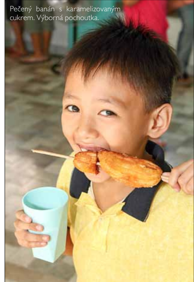
Pečený banán s karamelizovaným cukrem. Výborná pochoutka.