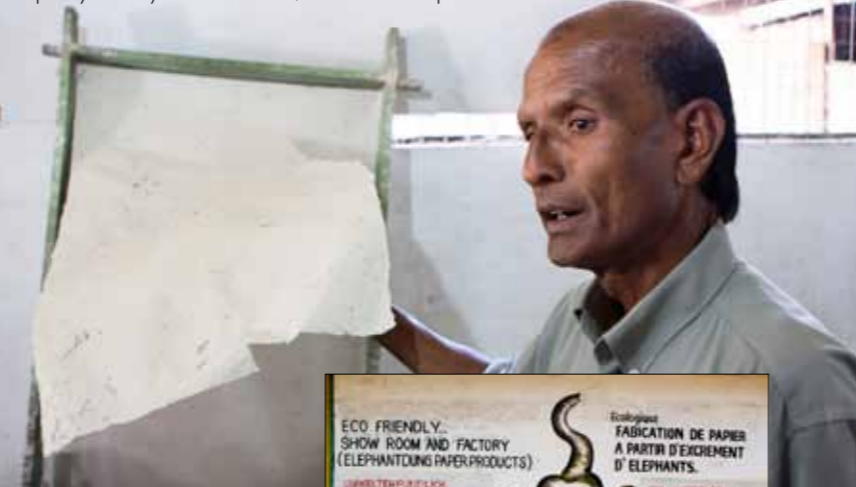
Papír vyrobený ze sloního ... , no radši si to přečtete sami.

ti ukazují slonům, kudy se mají vydat. Zvířata nejspíš tuší, že je čekají radovánky ve vodě, proto vcelku ochotně typickou rozváznou chůzí opouštějí areál. V sirotčinci tak zůstávají jen sloni neschopní chůze, mezi nimi má smutný primát trojnohý Sáma, kterého o přední končetinu připravila nášlapná mina. Míříme do malého muzea zaměřeného na výrobu sloního papíru. Základní surovina je velmi dostupná, jedná se totiž o sloní trus, který po vysušení, lisování a máčení ve vodní lázni lze opravdu používat jako papír. Aniž bychom po tom nějak zvláště toužili, dávají