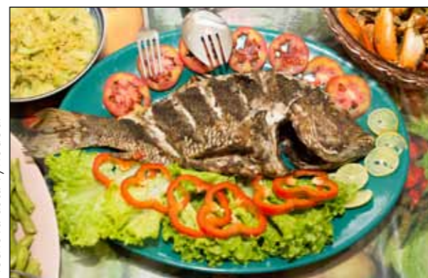
Typické srílanské jídlo. Plechová ústa výhodou.