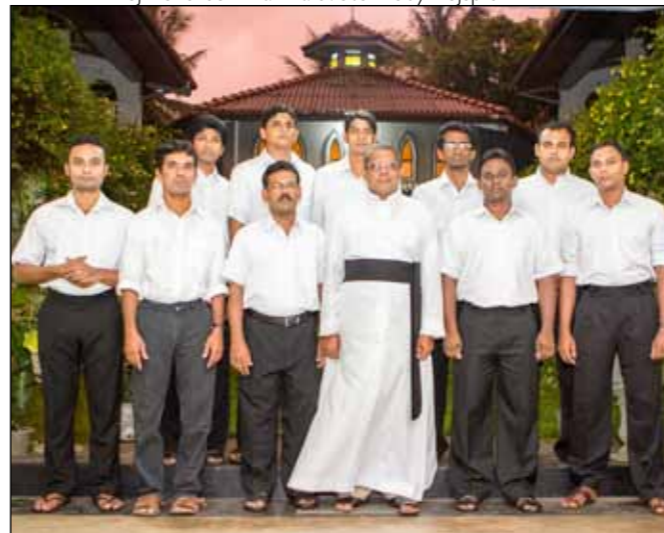
Nejmenší seminář na světě. Tedy nejspíš.

V dávných dobách byl ostrov známý pod různými jmény. Staří Řekové mu říkali Taprobané, Arabové Serendib. Portugalci ho roku 1505 zanesli na mapu jako Ceilão, z čehož vzniklo pozdější anglické Ceylon a české Cejlon. V roce 1972 byl přejmenován na Srí Lanku. Většina obyvatel ostrova aspoň jednou do roka navštíví vrchol hory Srí Pada (Svatá stopa), 2 224 m n. m., také nazývané Adamova hora, kde je otištěno ve skále velké chodidlo: křesťané a muslimové věří, že Adamovo, buddhisté Buddhovo, hinduisté Šivovo.