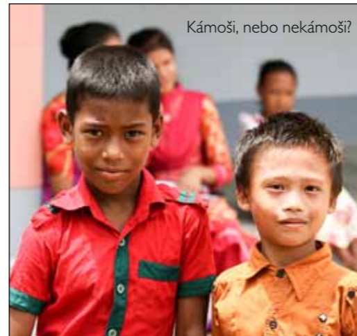
Kámoši, nebo nekámoši?