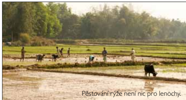
Pěstování rýže není nic pro lenochy.