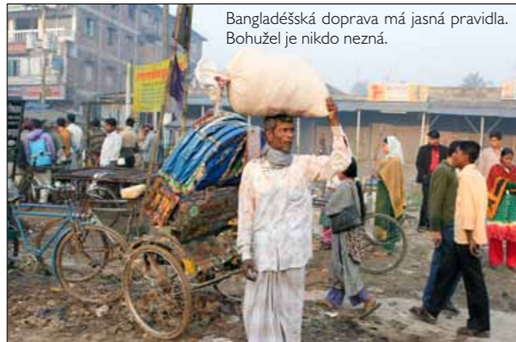
Bangladéšská doprava má jasná pravidla. Bohužel je nikdo nezná.