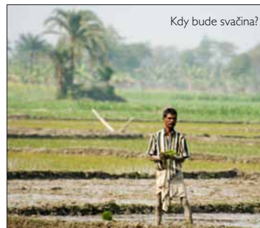
Kdy bude svačina?