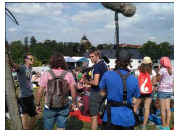
Příprava dalšího dílu seriálu Církev za oponou.

LÁKÁ TĚ ZAPOJIT SE DO TVORBY SIGNÁLŮ? Noví spolupracovníci jsou vítáni.