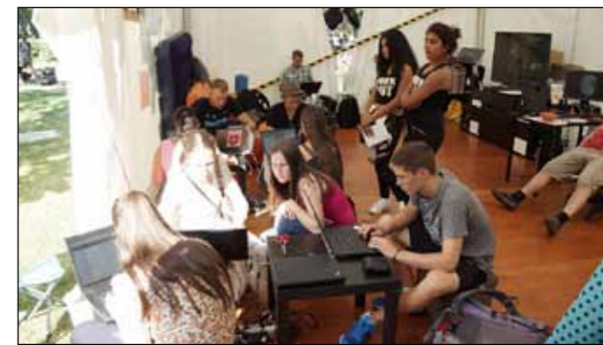
Tým Signálů pravidelně vyjíždí na akce, jako je CSM v Olomouci.