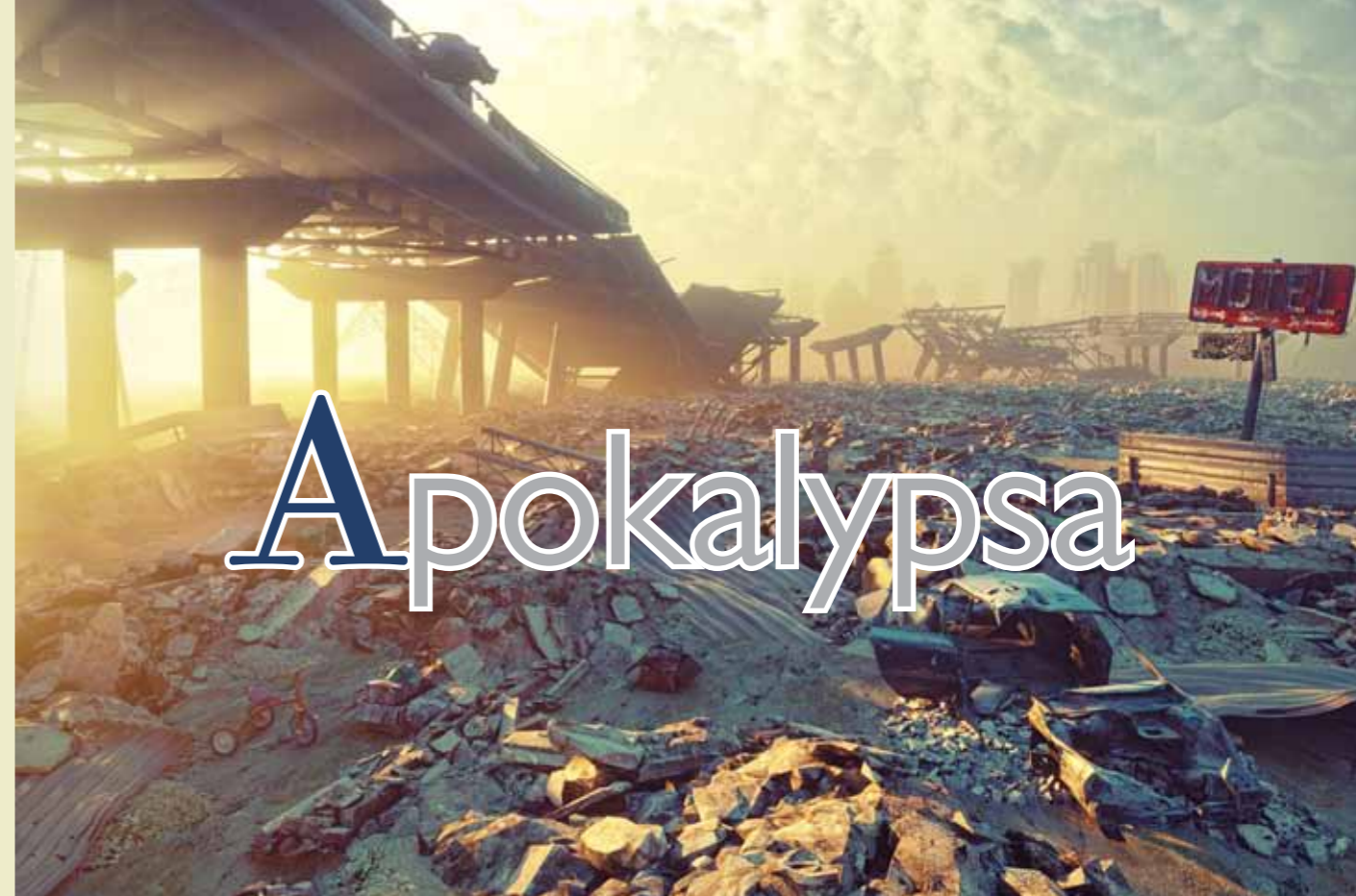
Ilustrace: victor zastol'skiy