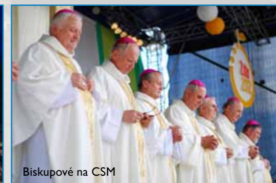
Biskupové na CSM

CSM představuje národní oslavu největší světové mládežnické akce katolické církve, kterou jsou Světové dny mládeže, jež se konají každé 2–3 roky, a vrcholem těchto setkání je modlitební vigilie a druhý den mše svatá se Svatým otcem. Poslední setkání bylo minulý rok v Madridu a hned příští rok bude v Rio de Janeiro 22.–28. července 2013.