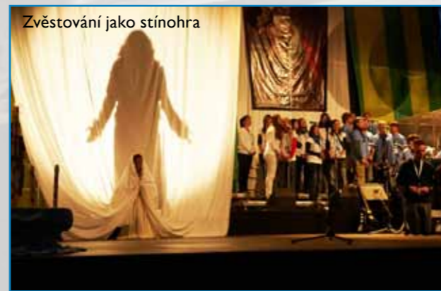
Zvěstování jako stínohra