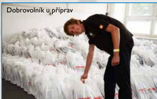
Dobrovolník u příprav