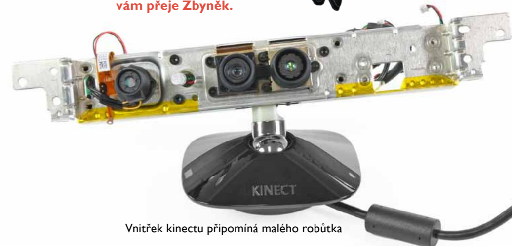
Vnitřek kinectu připomíná malého robůtka