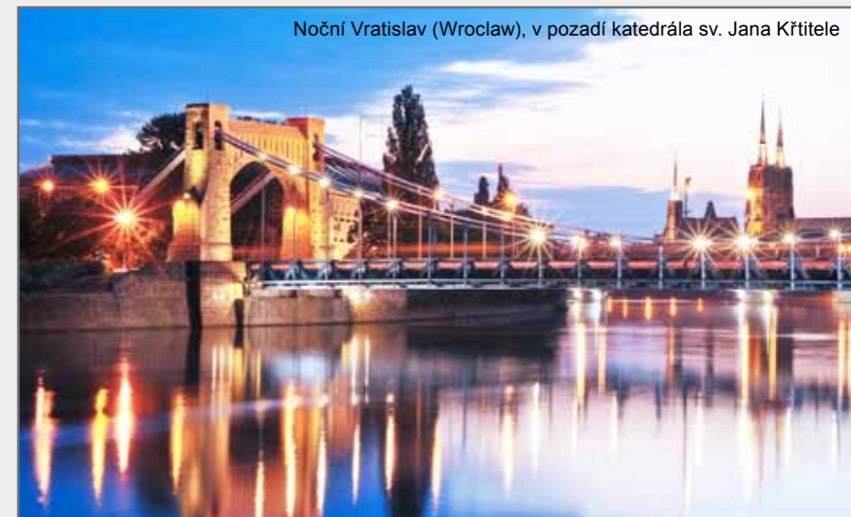
Noční Vratislav (Wrocław), v pozadí katedrála sv. Jana Křtitele

https://cs.wikipedia.org/wiki/Robert_Spiske