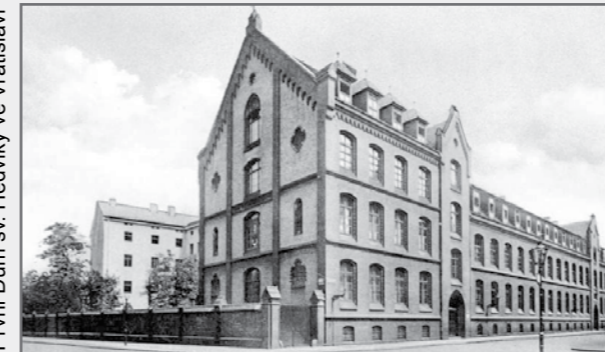
První Dům sv. Hedviky ve Vratislavi

P. Robert podlehl záchvatu mozkové mrtvice 5. března 1888. V lednu 2009 vydal papež Benedikt XVI. dekret o hrdinských ctnostech a Robert Spiske byl prohlášen za ctihodného. V současnosti je tedy kandidátem na blahorečení. Je patronem kazatelů, sester hedviček a města Wrocławu.