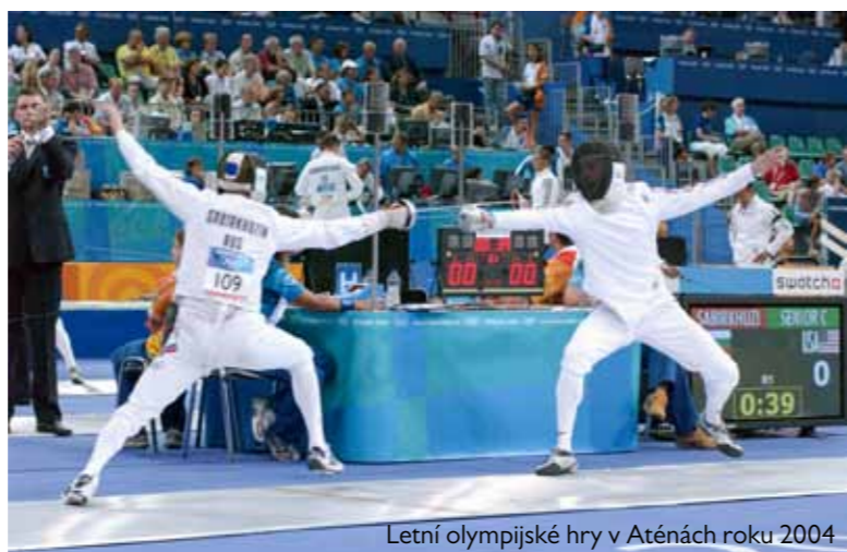
Letní olympijské hry v Aténách roku 2004

Problémy s organizací – peníze, nedostavená sportoviště a infrastruktura, virus Zika. Olympijský park Lipno (Ostrava, Plzeň, Pardubice), jakožto sídlo českých fanoušků, kde si budou moci návštěvníci vyzkoušet olympijské disciplíny.