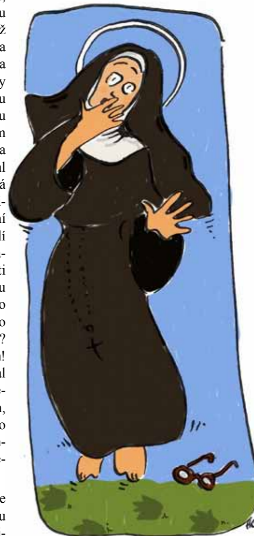
Ilustrace: Helena Filčíková

vnitřní život. Zjistila, že lidská duše má své krajiny, své komnaty, svá skrytá sklepení a své rozlehlé plázně. Konečně pochopila, že zatímco měla spoustu vnějších zájmů, čekal v ní na ni Bůh, až se k němu uráčí přijít. A ona přišla. Stala se jednou z vnitřních duší. Znáte to: jsou lidé, kteří toho navenek udělají moc – ale uvnitř jsou prázdní a ploší. Jejich nitro je jako nudné předměstí plné paneláků. A pak jsou lidé nenápadní a skrytí, jejichž duše skrývá rozeklané hory a hluboká údolí a v údolích hrady a v hradech ne jeden poklad. Lidé, jimž je radost být blízko. Vnitřní život – to je velký objev svaté Gertrudy (a mnohých světců před ní i po ní, všech těch, kdo se nebáli začít s modlitbou). A pokud tento objev bude panu šéfredaktorovi málo, pak se s vámi loučím. Až při četbě bulvárního tisku narazíte na nadpisy „Lidé si po měsíci všimli, že jim ve farnosti chybí kněz, nyní se pohřešuje“ a „Ochočený aligátor v zahradě redakce časopisu Tarsicius vydávil plastový koláček“, vězte, že obě události souvisejí. Můžete zapálit svíčku a ronit krokodýlí slzy.