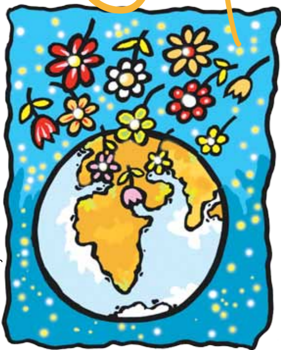
Ilustrace: Jiří Vančura

Paní Leslie se vracela domů, šťastná láskou, jakou onen muž miloval svoji maminku. Začali jsme nový rok 2017. Kéž jej naplníme skutky lásky, mezi nimiž nebudou chybět kytiky pro maminku, babičku, paní učitelku nebo pro „nějakou paní“ v supermarketu.