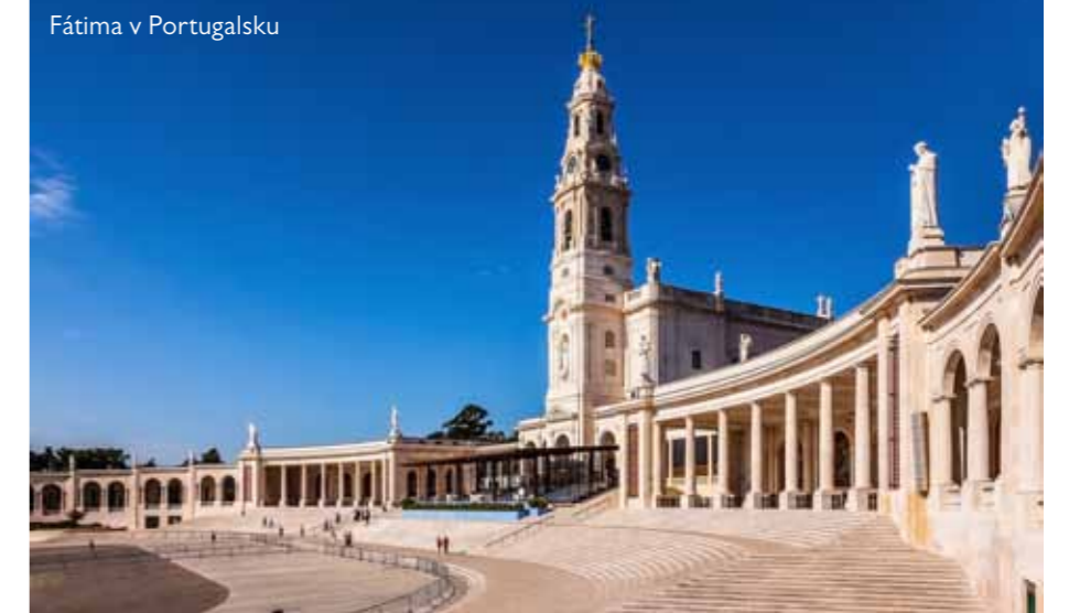
Fátima v Portugalsku