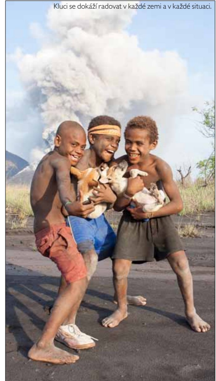
Kluci se dokáží radovat v každé zemi a v každé situaci.