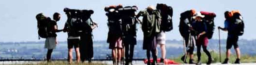
Poutníci před Mont-Saint-Michel