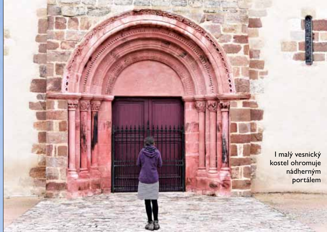
I malý vesnický kostel ohromuje nádherným portálem

Důležitější byly Velikonoce, kdy připomínáme Boha, který se obětuje, toho, který se dává z vlastní vůle zabít a který je zároveň i člověkem. To je ta novinka a radikálnost křesťanství. Výjimečné je i datum Velikonoc, které se zvláště počítá, i to, že