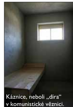
Káznice, neboli „díra“ v komunistické věznici.

Děkujeme za rozhovor a přejeme mnoho Božího požehnání do vaší služby.