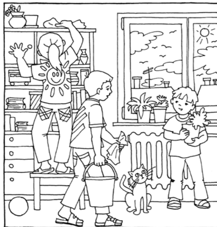
Ilustrace: Iva Fukalová