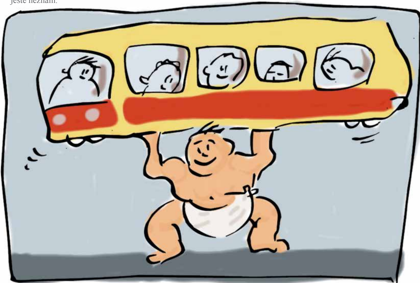
Ilustrace: Helena Filčíková

„Co budeme dělat?“ ptali se lidi v šalině nervózně a obraceli se jeden na druhého. „Přece tu nebudeme stát dvě hodiny! Jenže nikdo nedovedl odpovědět, natož pomoci.“