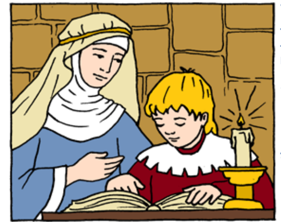
Ilustrace: Iva Fukalová

„Mami, tys říkala, že jestli dostanu z písemky jedničku, že budu moct na zákusek do cukrárny?“ „Ano, jistě.“ „Hurá, takže dnes můžu do cukrárny na pět zákusků!“