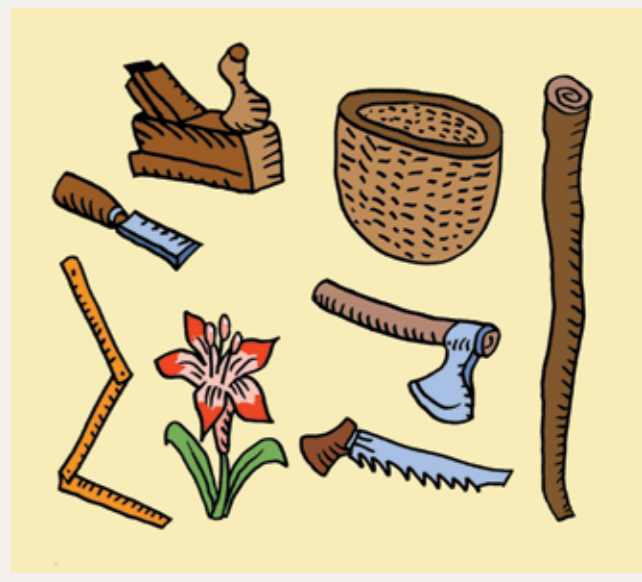
Autor obou ilustrací: Jiří Vančura

Na obrázku vidíš různé předměty, které mohou být všechny atributy jednoho svatého. Uhodnete jeho jméno?