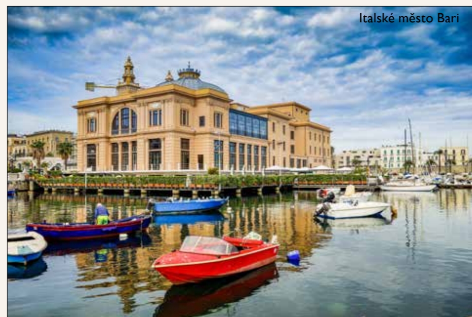
Italské město Bari

O velké oblibě a dosahu života této mladé dívky svědčí mimo jiné i dva filmy, které o ní byly v roce 2019 natočeny. 1