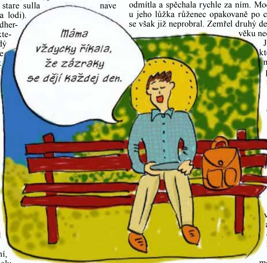
ILUSTRACE: J. BARHON