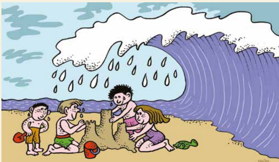
Ilustrace: Jiří Vánčura

Teprve, když se přesvědčí, že nikdo na břehu nechybí, s úlevou říká: „Děti jsou všechny v pořádku, to je dobře, moc dobře,“ a jeho srdce, zasažené infarktem, se najednou zastavuje a on vydechuje naposled. Vyděšení malí ministranti i další farníci se zalykají slzami a nechápavě obklopují statné, ale nyní bezvládné tělo pana faráře, ležící na pláži. Je zhruba 11 hodin dopoledne, když přivolaný lékař potvrzuje, že knězi již není pomoci.