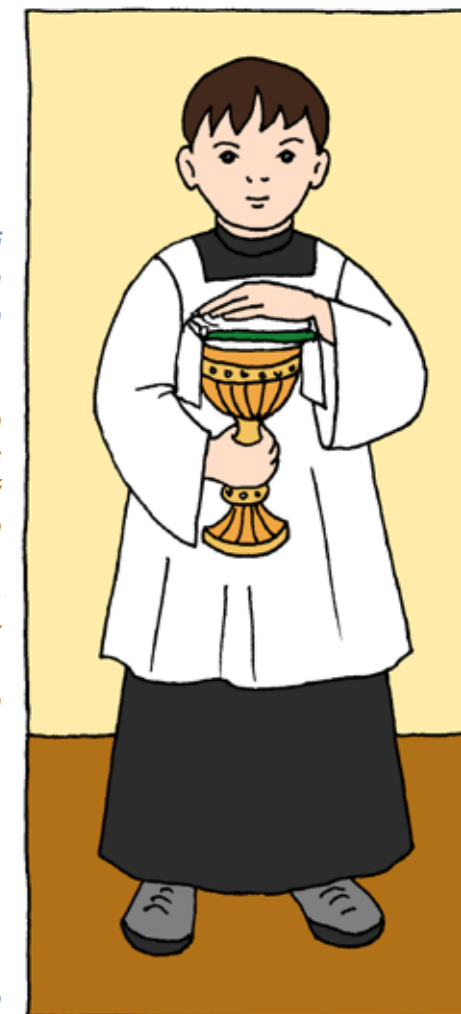
Ilustrace: Iva Fukalová

frézie, narcis, krokus, tulipán, hyacint, sasanka, bledule, petrklíč, konvalinka