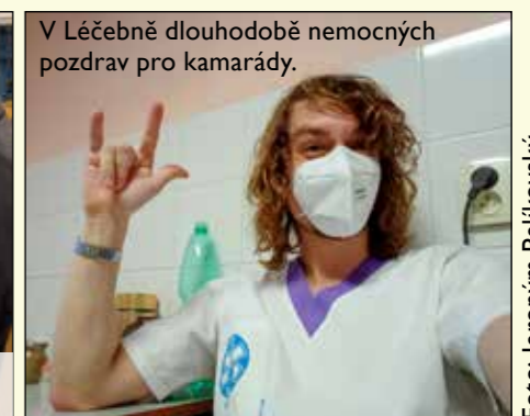
V Léčebně dlouhodobě nemocných pozdrav pro kamarády.