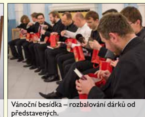
Vánoční besídka – rozbalování dárků od představených.