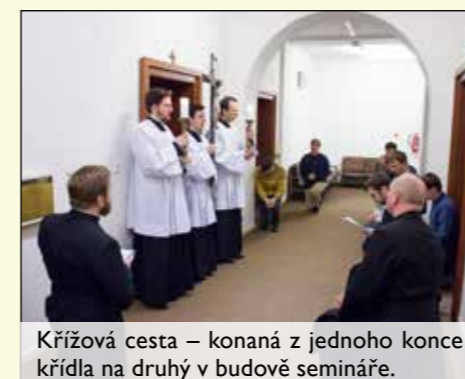
Křížová cesta – konaná z jednoho konce křídla na druhý v budově semináře.