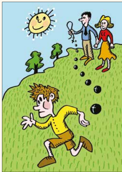
Ilustrace: Jiří Vancůra

Matěj jde rychle spát, ale než usne, tak ho napadne škaredé podezření. Zprvu je zahání, ale nakonec si je připustí. Modlí se rodiče opravdu ten dlouhý růženec, anebo to před ním jenom hrají? Nemůže kvůli tomu spát. Otevírá tedy co možná nejtíši