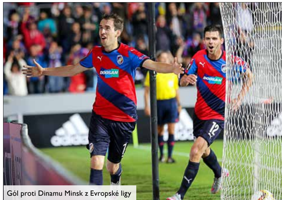
Gól proti Dinamu Minsk z Evropské ligy

Velmi doporučuji si v kolektivu na nic nehrát, být sám sebou. Rozvíjet poklady, které člověk má. Být ve věcech upřímný.