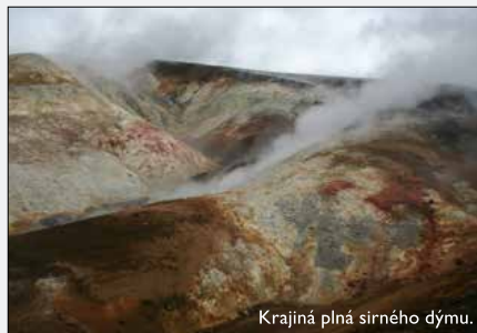
Krajiná plná sirného dýmu.

Druhý den ráno mně jeden z obyvatel chatky poradil, ať se vydám na výlet ke gejzírnímu. Nadšeně jsem vyrazil, ale po dvou hodinách chůze jsem místo gejzíru objevil pouze pár kouřících termálních jezírek a jaké bylo mé rozčarování, když jsem zjistil, že někdo spalil všechno dřevo. V těchto turistických chatkách platí nepsaný zákon, že všechno se musí nahradit a připravit pro nové příchozí. Někdo si ale zřejmě udělal teplo a pak se sobecky vykašlal na přípravu nových polínek. Nedalo se nic dělat: popadl jsem dlouhým používáním ztupenou sekeru a našťápal si pořádnou zásobu dříví. Za chvíli už bylo teplo, rozvěsil jsem mokré věci po chatce a natáhl si nohy ke kamnům. O další cestě si povíme zase až v příštím čísle.